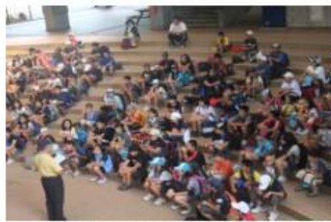
説明を真剣に聞く児童達