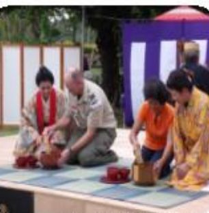
活動体験 古式ゆかしく「ぶくぶく茶」