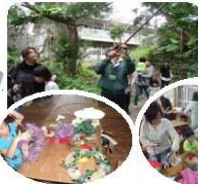
親子でクリスマスリース作り