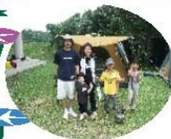
春の親子キャンプ