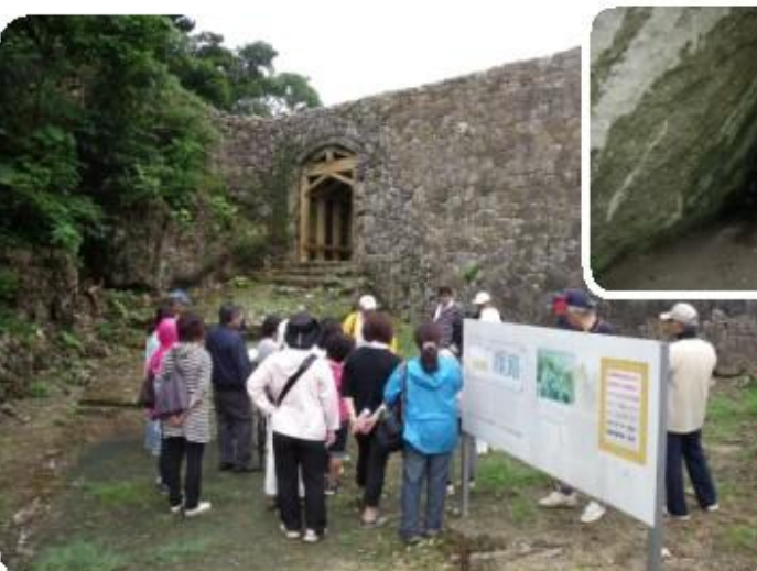
歴史探訪「東御廻い」古きを訪ねて新しさを知る