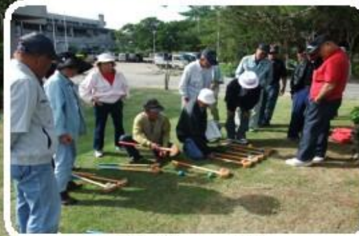
どれがいいのかな～