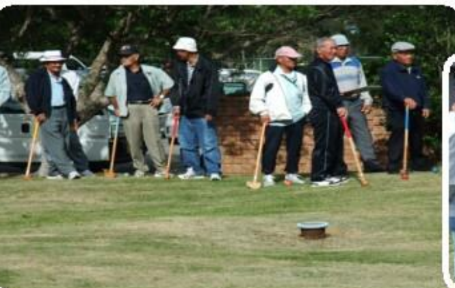
「グランドゴルフ」仲間との楽しいひととき