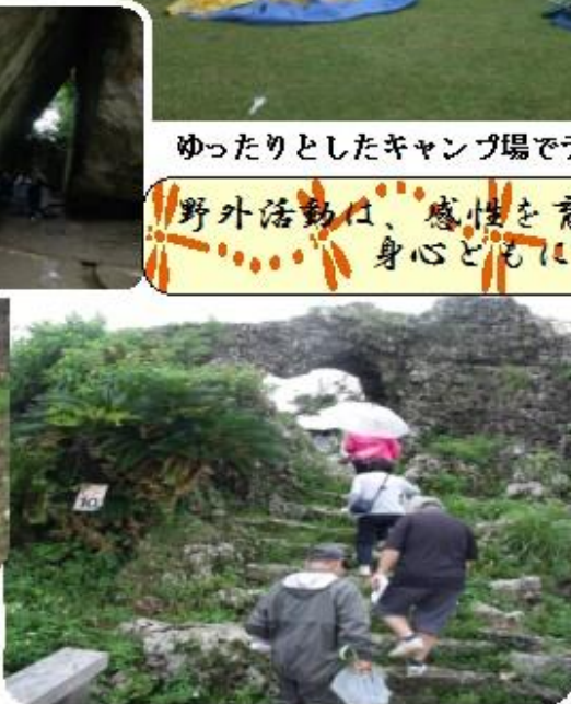
ゆったりとしたキャンプ場でテント設営