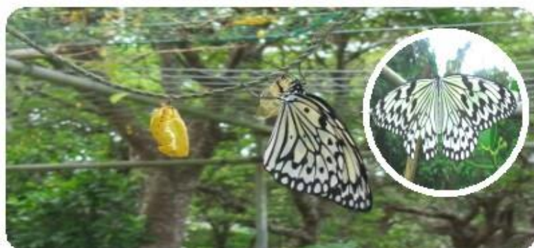
オオゴマダラとサナギ (黄金色) のある風景