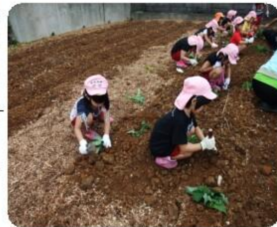
芋はいつできるのかな! 真剣にカズラを植える保育園児たち