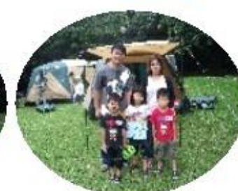
家族の絆より深く