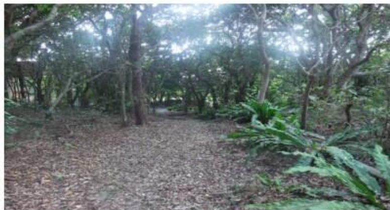
自然豊かな構内、研修環境として最適