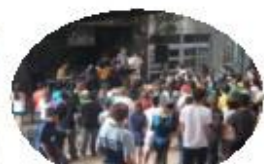
キャンプ in 玉城