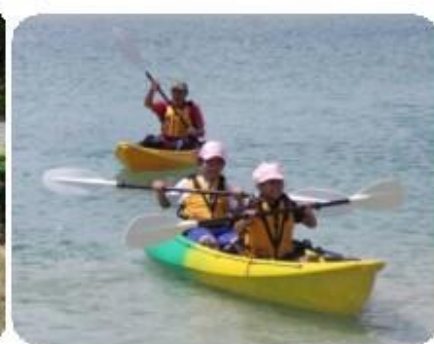
青春の思い出・友情を育む少年少女キャンプ