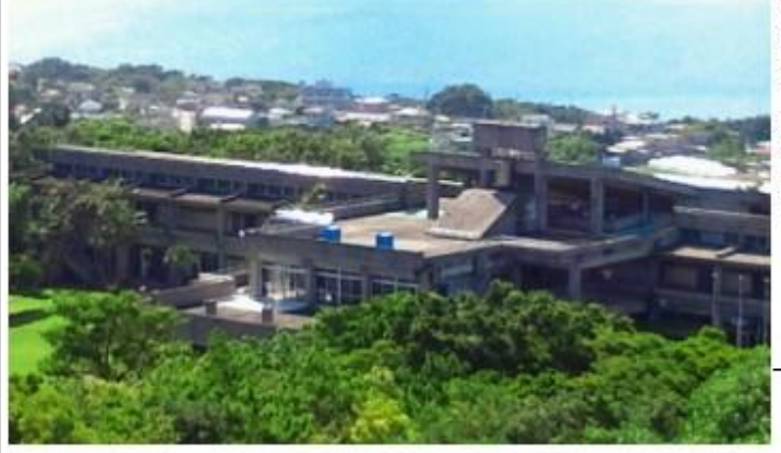
自然豊かな玉城青少年の家全景 (後方百名集落)

これからは私たちは、学校教育の関連施設としての原点を踏まえつつ、広く地域社会に開放し、保育園や児童クラブ、子供会や各種サークルなどの団体、スポーツクラブ、PTA、女性(婦人)会、老人会、青年会、自治会関係、その他一般の方々など、多くの皆様に積極的にご利用頂けるよう