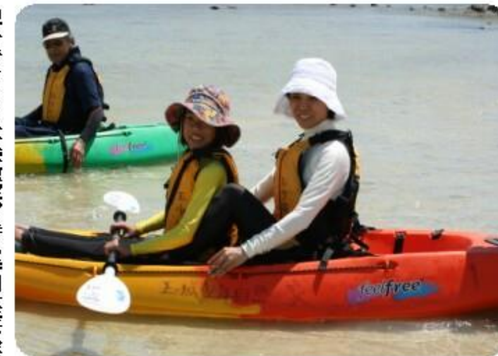
ニコリといってきま〜す