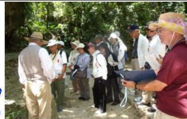
歴史探訪パートII (南城市の拝所を訪ねて)