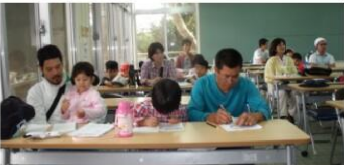
野草観察の前に研修室でまず学習