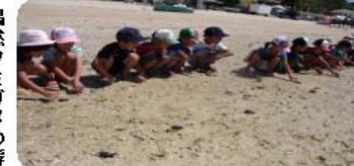
大海原に向かう赤ちゃん亀を必死に励ます