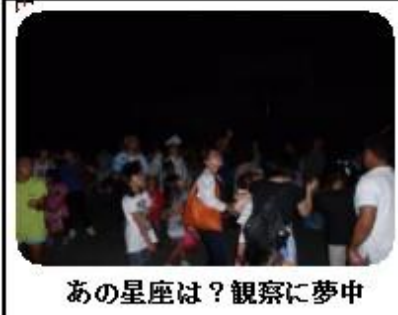
あの星座は？観察に夢中