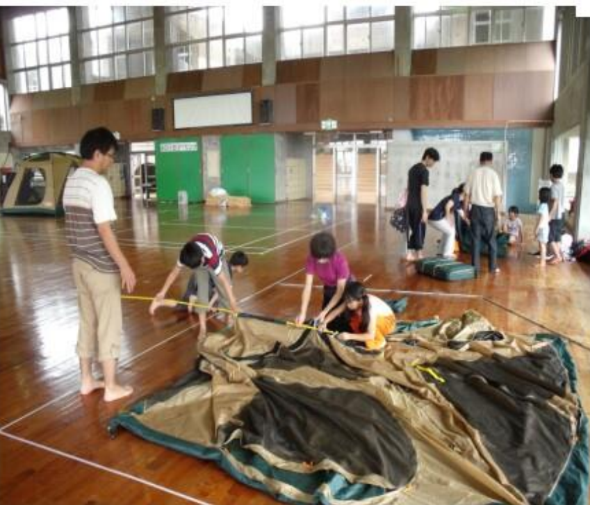
ファミリーキャンプ。テント撤収も力合わせて！