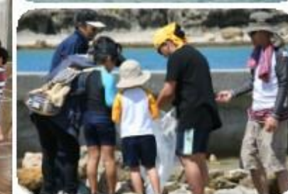
親子でカメラ体験教室。待ち時間は美化活動