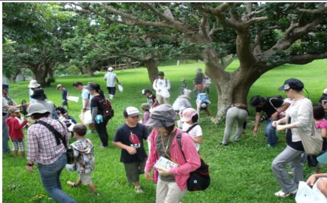
所内の広場は野草の宝庫。資料片手に野草さがし