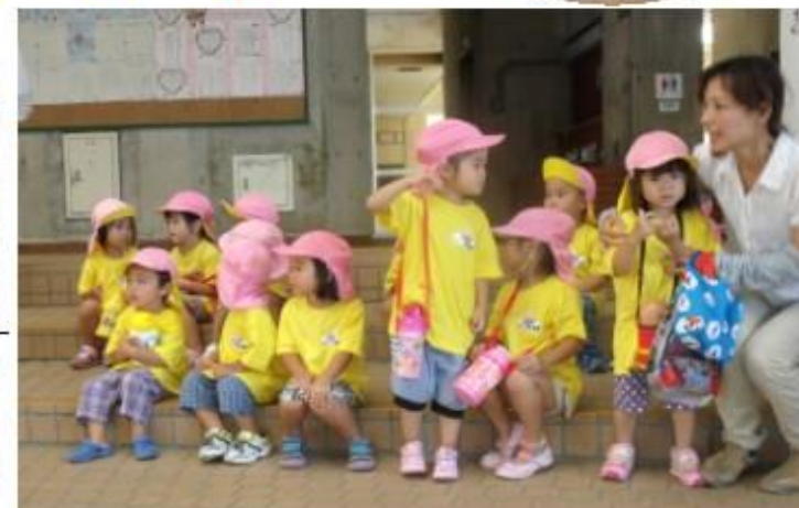
いも植え体験に出かける気合十分の園児たち