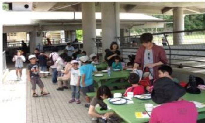
採取した野草をテンプラにして試食