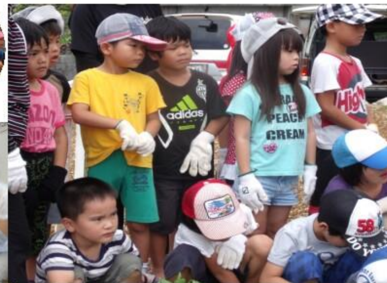
イモのつるの植え方について真剣な表情の園児たち