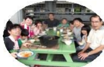
自分たちで作ったカレーはちよっおいしいな