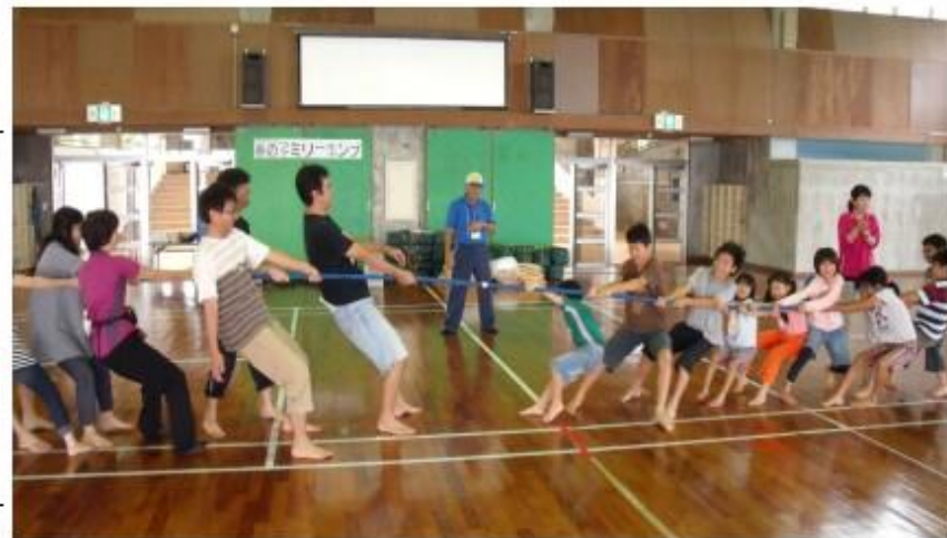
東西に分かれて力と力の勝負は真剣そのもの