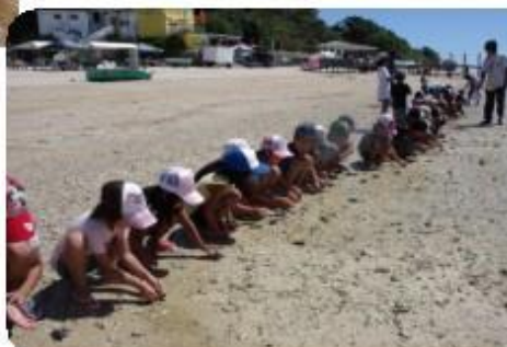
偶然ウミガメの孵化に遭遇。赤ちゃんガメに「早く大きくなあれ」と学童の子どもたち