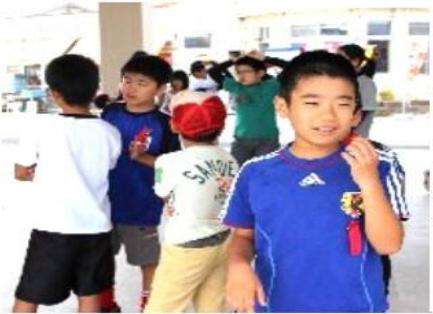
左 どれもこれも初体験 何をしても楽しい