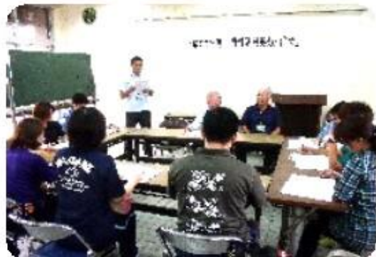
野外活動指導者の研修会