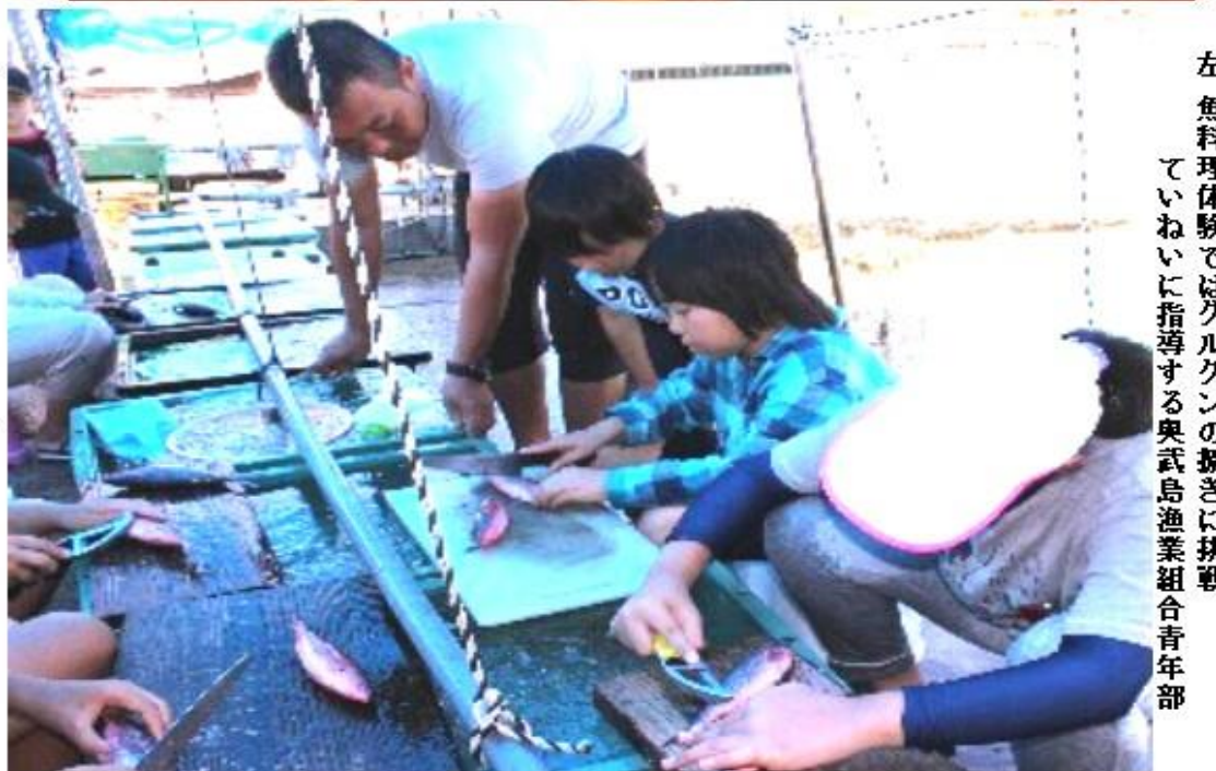
左 魚料理体験ではグルクンの捌きに挑戦 ていねいに指導する奥武島漁業組合青年部