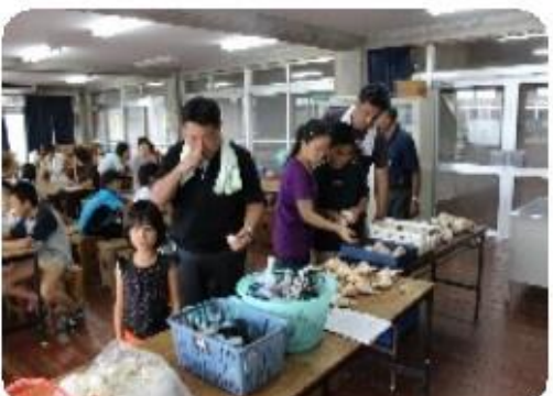
夏のファミリーキャンプ 朝食づくり