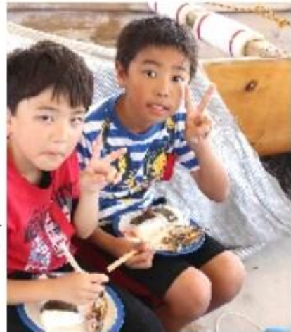
グルクンの空揚げにご満悦