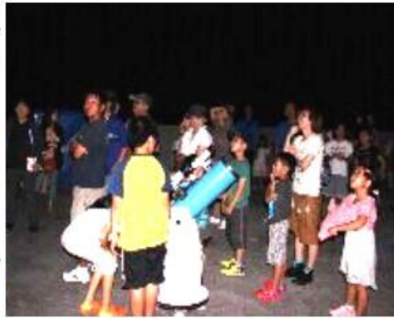
望遠鏡からくっきり見えた土星の環に感激!