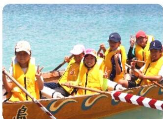
生まれて初めて櫂を手にハーリー体験 楽しいな