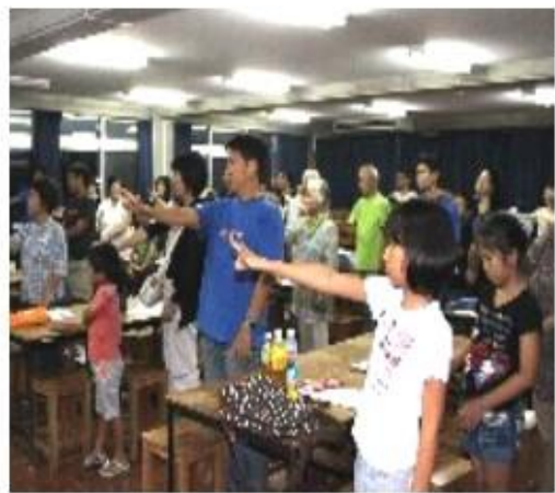
腕を使って星座の観察方法を学ぶ