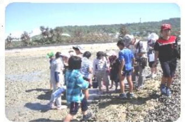
海辺の生物観察 児童ら興味津々 左