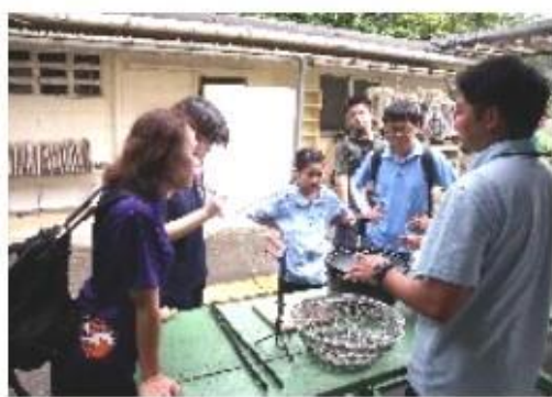
野外指導者研修会野外炊飯実技研修