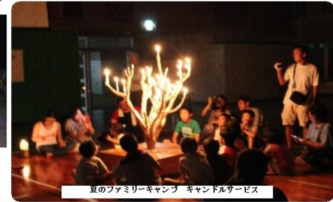
夏のファミリーキャンプ キャンドルサービス