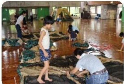
夏のファミリーキャンプ テント設営